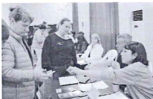
Участники ярмарки интересовались вакансиями и условиями предлагаемой им работы.

Ярмарка продлилась два дня: 14 и 15 апреля. За это время её посетили 477 ищущих работу граждан, 380 школьников и учащихся среднего профессионального образования. Участники ярмарки общались с представителями 23 работодателей Мостовского района и Карачаево-Черкесской Республики, которые заявили 177 вакансий различных специальностей. Презентации своих учебных заведений показали студенты восьми колледжей и высших учебных заведений из Краснодар, Армавира, Мостовского и Лабинского районов. Проведённые мастер-классы позволили ребятам окунуться в мир профессий повара, медицинского работника, слесаря по ремонту различного оборудования и даже конструктора и нефтяника.