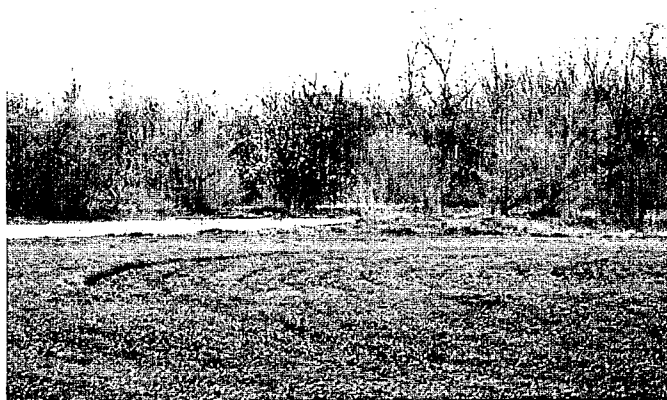
Фото 1. Сельскохозяйственные угодья, граничащие с урочищем Пионер

Фотографии памятника природы регионального значения: