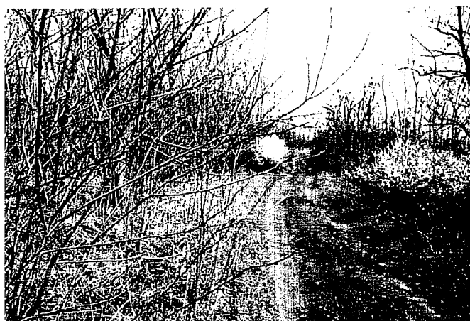
Фото 2. Участок грунтовой дороги, проходящий по территории урочища Пионер

Начальник управления охраны окружающей среды